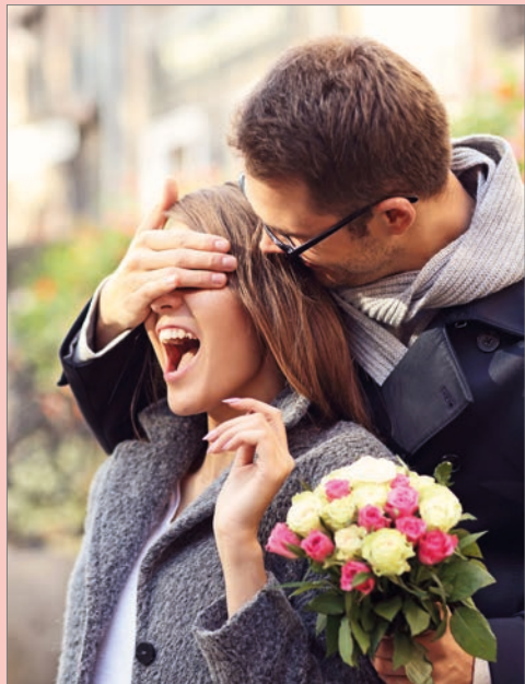
Bei einem romantischen Kurzurlaub können frisch Verliebte ihre junge Beziehung beflügeln.

liche Stunden zu zweit genießen. Was die Hotels betrifft, hat man die freie Wahl: Die Häuser befinden sich beispielsweise auf Rügen, im Harz, im Sauerland, im Westerwald, im Schwarzwald und in vielen weiteren reizvollen deutschen Regionen, aber auch im benachbarten europäischen Ausland wie in Österreich, der Schweiz und der Tschechischen Republik. Die Kurzurlaube sind drei Jahre ab Ende des Gutschein-Kaufjahres buchbar, die romantischen Wochenenden werden bereits für 229,90 Euro angeboten. Der Urlaubsgutschein kann in einer edlen Geschenkbox bestellt oder sofort zu Hause ausgedruckt und am Valentinstag überreicht werden.