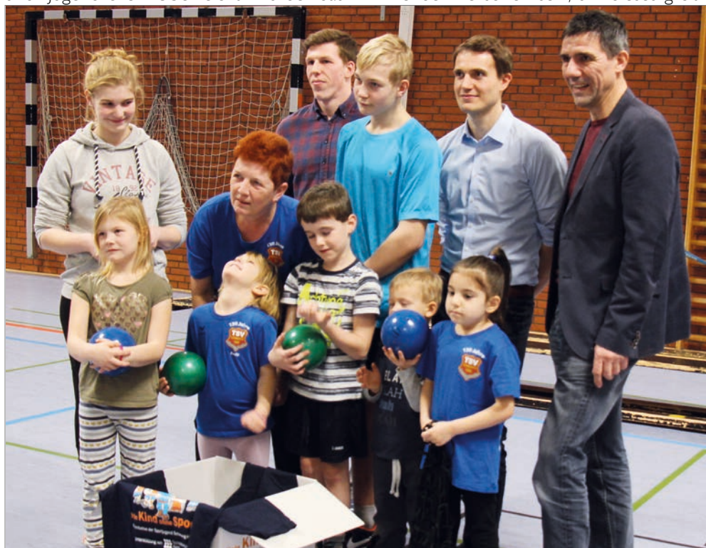
Der TSV-Vorwärts durfte sich über ein buntes Paket, bestehend aus einem zweckgebundenen finanziellen Zuschuss, Sportmaterialien, einem Beratungsangebot und Fortbildungsgutscheinen, im Gesamtwert von 450 Euro freuen.