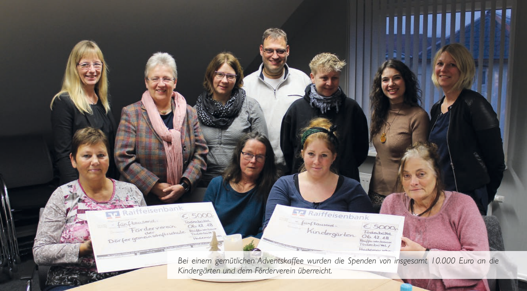
Bei einem gemütlichen Adventskaffee wurden die Spenden von insgesamt 10.000 Euro an die Kindergärten und dem Förderverein überreicht.