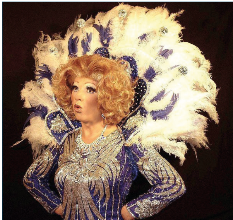
Travestieshow der Extraklasse am 13. April 2019 im Gasthaus Gosch

Oldenbüttel - Die Onkel Tanten Kunst der Verwandlung mit Auflegen wieder los, denn Lachen ist tritten bei Geburtstagen, Jubiläen, bekanntlich die beste Medizin! Am Hochzeiten sowie Betriebsfeiern.