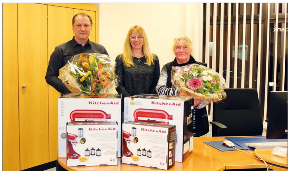
Viele attraktive Gewinne warten auch in diesem Jahr wieder auf die Loskäufer.

Weihnachtsgeld) beiseitelegen: Von den 6 Euro pro Los werden 4.50 Euro monatlich gespart und im Dezember eines Jahres wieder ausgezahlt. Im Dezember 2018 konnte die Raiffeisenbank neben diversen kleinen Geldbeträgen