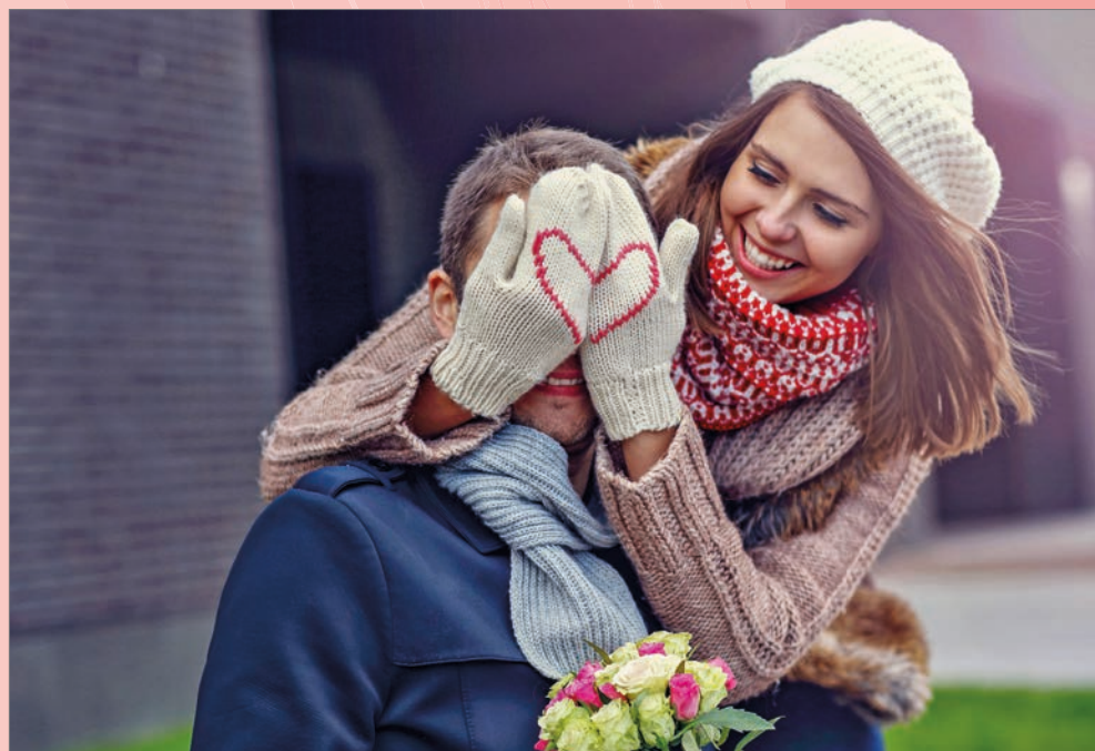
Der Valentinstag am 14. Februar ist die beste Gelegenheit, seinem oder seiner Liebsten das Wertvollste zu schenken, was man hat: gemeinsame Zeit.

Viele Ideen für romantische Erlebnisgeschenke gibt es beispielsweise auf www.urlaubsbox.com . Dort steht eine große Auswahl an Gutscheinen für einen exklusiven romantischen Kurzurlaub für zwei Personen bereit. Mit Beauty- und Wellnessangeboten kann man sich bei zwei Übernachtungen in gemütlichen „Kuschelhotels“ verwöhnen lassen und zärt-