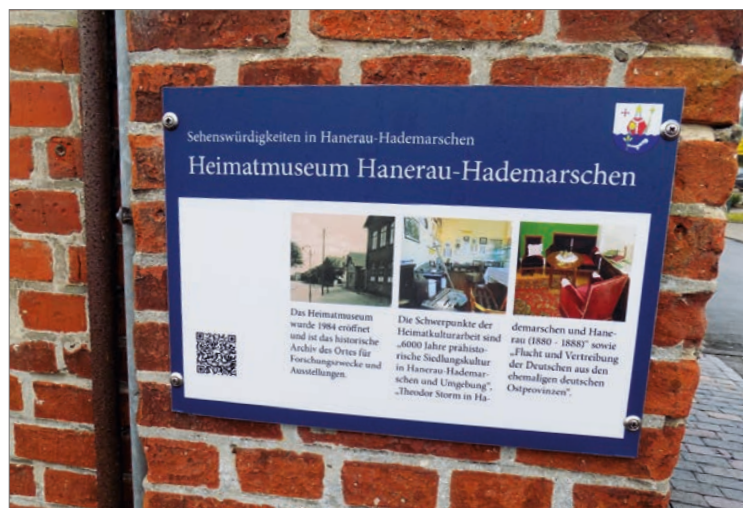
Insgesamt 26 neue Schilder sind geplant, um in Zukunft auch digital Informationen zu den Sehenswürdigkeiten bereitzuhalten.